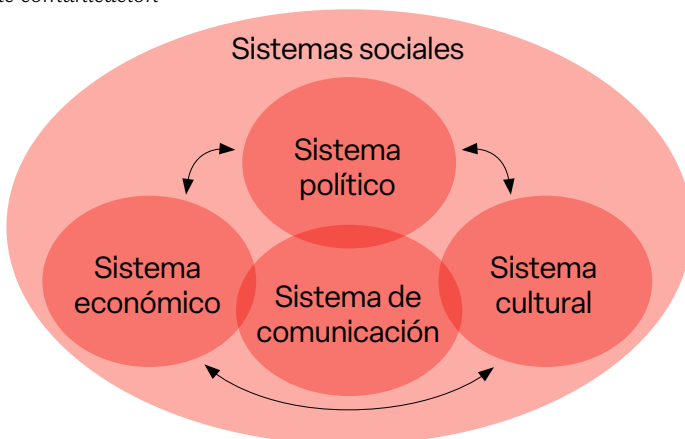
El sistema de comunicación

Nota. Elaboración propia, a partir de Urteaga, 2009.