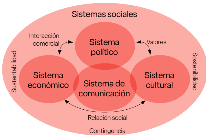
Propósito del comunicador corporativo en los sistemas sociales