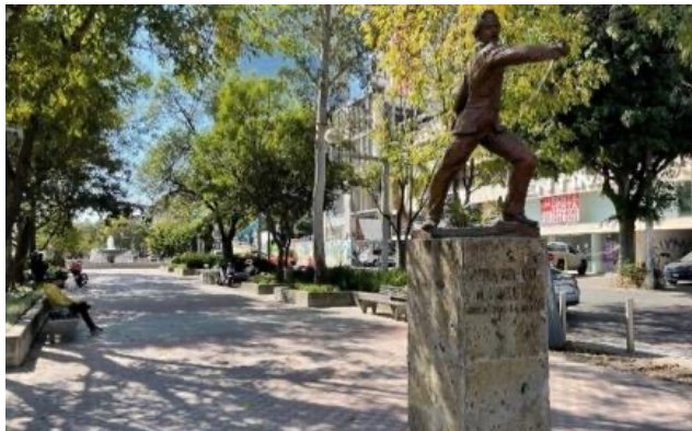
Figura 11. Camellón peatonal de la Avenida Chapultepec Nota. Camellón peatonal de la Avenida Chapultepec en el cruce con la calle Justo Sierra en Guadalajara, Jalisco, México. En el primer plano, la escultura en bronce de Francisco Márquez, uno de los llamados Niños Héroes. Al fondo, una de las fuentes de esta avenida.

La Avenida Chapultepec, que corre de norte a sur y cuyo límite septentrional es la Avenida México, tiene al centro un arcén, andador o camellón peatonal, con jardineras y árboles, que divide las dos calzadas de la avenida –similar a la Rambla de Barcelona, Cataluña, España, y otras ramblas catalanas y del Levante español– donde se pueden encontrar también, a lo largo de ella, bustos escultóricos de los Niños Héroes y varias fuentes (Figura 11).