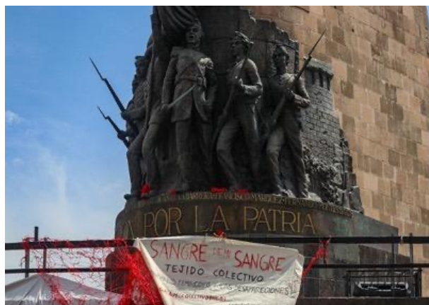
Figura 5. Conjunto escultórico de los Niños Héroes

Nota. Conjunto intervenido por la Colectiva Hilos, titulado «Tejido colectivo contra los feminicidios y las desapariciones» en el Monumento a los Niños Héroes, en Guadalajara, Jalisco, México.