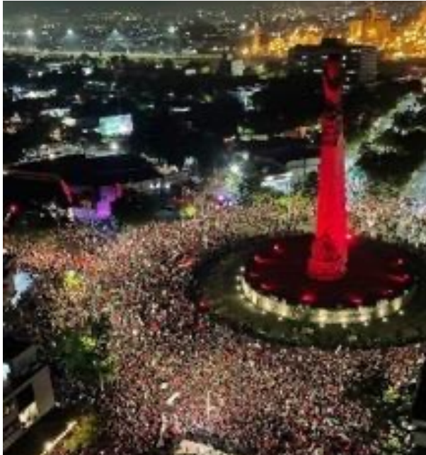
Figura 13. Celebración en el Monumento a los Niños Héroe

Nota. Celebración de la afición del Atlas Fútbol Club (apodada «La Fiel») el 12 de diciembre de 2021 en el Monumento a los Niños Héroe, luego de la obtención de su segundo campeonato de la Liga Mexicana de Primera División (Liga MX), a 70 años de su primer título, en 1951.