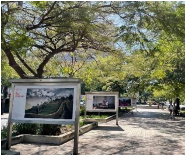
Figura 12. Exposición fotográfica «El País que Imaginamos»

En su camellón, frecuentemente, se cumplen diversas actividades culturales, exposiciones fotográficas y de artes plásticas (Figura 12) y varios días de la semana se instala por las tardes un mercado o «tianguis» –como se les conoce en México– de artesanías y manufacturas locales. A pesar de que la Avenida Chapultepec continúa todavía al sur del Monumento a los Niños Héroe, esta glorieta constituye el límite austral de la actividad que se desarrolla regularmente en esa vía.