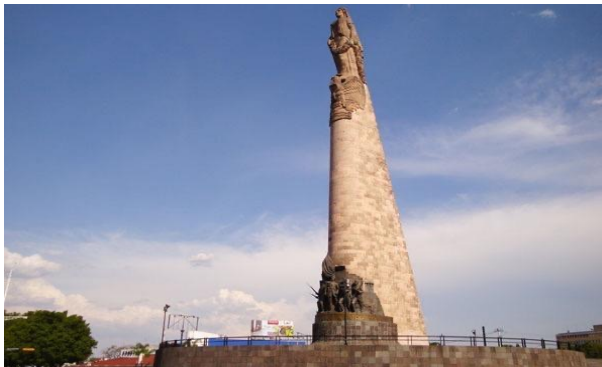
Figura 3. Vista oriente del Monumento a los Niños Héroes

Nota. Vista Poniente del Monumento a los Niños Héroes antes de su intervención durante las protestas de 2018 en adelante en Guadalajara, Jalisco, México. Tomado de Glorieta de los Niños Héroes , por Zona Guadalajara ( https://zonaguadalajara.com/glorieta-de-los-ninos-heroes/ ).