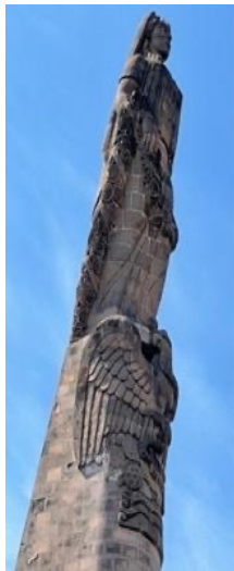
Figura 4. «La Patria»

En el caso del Monumento a los Niños Héroes, se trata de cantera rosácea. En su remate, esculpida en la cantera, se encuentra la figura de una mujer, representando la alegoría de la Nación Mexicana, referida como «La Patria» (Figura 4). Está vestida con una túnica, un manto sobre la cabeza, cabello trenzado y sostiene una guirnalda de rosas que descansa sobre su rodilla izquierda y cae hacia ambos costados. Mira altiva hacia el norte. A sus pies, se encuentran los elementos del escudo nacional mexicano: un águila devorando una serpiente, posada sobre un nopal en medio de un lago, que representa la fundación de Tenochtitlan, actual Ciudad de México