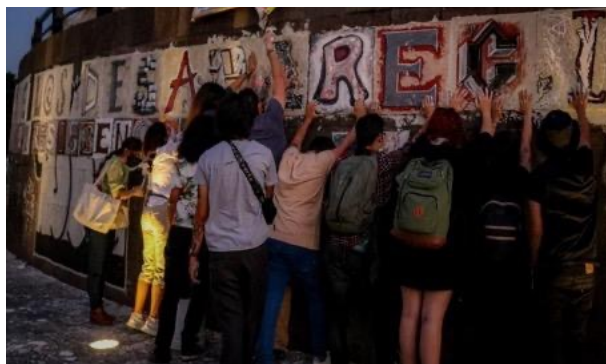
Figura 17. «Glorieta de L@s Desaparecidos» y «Búsqueda y Resistencia»

Nota. Colocación de losetas el 19 de marzo de 2021 con la información de desaparecidos en el marco del tercer aniversario de la desaparición de Marco, Daniel y Salomón, estudiantes del CAAV, y César, estudiante de la Universidad de Guadalajara.