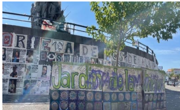
Figura 19. Detalle de las losetas adheridas al Monumento a los Niños Héroes Nota. Detalle de las losetas adheridas al Monumento a los Niños Héroes que forman las leyendas «Glorieta de L@s Desaparecidos» y «Búsqueda y Resistencia» y otras con datos de personas desaparecidas. Al frente, el «Jardín de la Memoria» con placas de madera con nombres de desaparecidos en su jardinera frontal en Guadalajara, Jalisco, México. Fotografía tomada por Marco Antonio Chávez Aguayo, el 2 de diciembre de 2021.