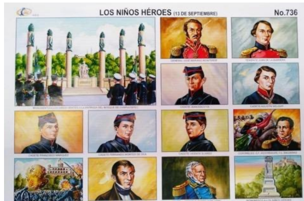
Figura 6. Lámina didáctica de los Niños Héroes país.

No obstante, a pesar de la falta de corroboración histórica y científica de los hechos ocurridos en esta batalla, el relato oficial de los seis cadetes que dieron su vida se ha convertido en una verdad institucional que se ha enseñado durante más de un siglo en la educación básica obligatoria del país (Figura 6).