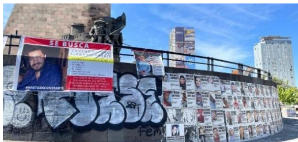
Figura 15. Losetas y lonas en la base del monumento

Nota. Losetas adheridas a la base del monumento y lonas atadas a los barandales de La Glorieta de Las y Los Desaparecidos o Monumento a los Niños Héroes en Guadalajara, Jalisco, México. Fotografía tomada por Marco Antonio Chávez Aguayo, el 2 de diciembre de 2021.