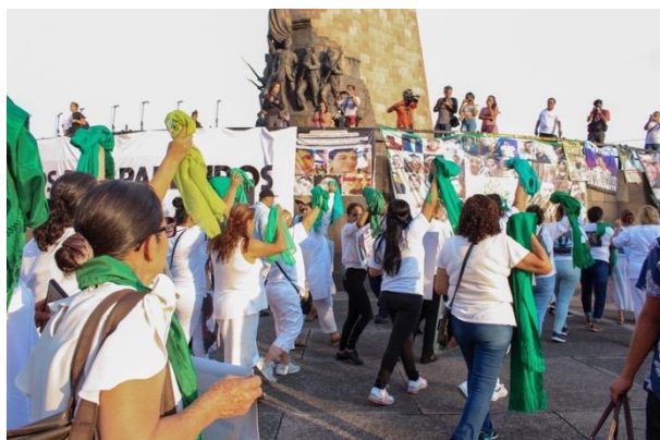
Figura 21. Manifestaciones en el Día Internacional de las Víctimas de Desapariciones Forzadas

Nota. En el Día Internacional de las Víctimas de Desapariciones Forzadas, madres y familiares del colectivo FUNDEJ llegando a la Glorieta de las y los Desaparecidos después de marchar desde el Templo Expiatorio, el 30 de agosto de 2019.