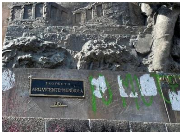
Figura 9. Detalle del Monumento a los Niños Héroes

ley» (Decreto 24952/LX/14, 2014, Art. 26). En las fichas del Inventario de estos elementos patrimoniales se estipula que su uso original está considerado como espacio público y que el grado de alteración que presenta es íntegra, así como que su grado de conservación es bueno (Secretaría de Cultura del Estado de Jalisco, 2015, 2019).