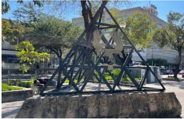
Figura 10. Monumento sobre la Avenida Chapultepec en Guadalajara, Jalisco, México Nota. El monumento cuenta con la leyenda: «En este lugar se encontraba el Ex-Colegio del Espíritu Santo cuyas instalaciones ocupó la Escuela Militar de Aviación del 15 de noviembre de 1943 al 18 de febrero de 1953».

La Avenida Chapultepec, que corre de norte a sur y cuyo límite septentrional es la Avenida México, tiene al centro un arcén, andador o camellón peatonal, con jardineras y árboles, que divide las dos calzadas de la avenida –similar a la Rambla de Barcelona, Cataluña, España, y otras ramblas catalanas y del Levante español– donde se pueden encontrar también, a lo largo de ella, bustos escultóricos de los Niños Héroes y varias fuentes (Figura 11).