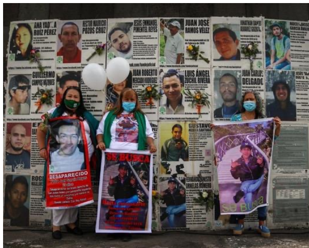
Figura 20. Manifestación enfrente de las losetas

Precisamente, durante la segunda década del siglo XXI, este monumento ha ido adquiriendo un significado diferente. Esta vez, no ha sido una iniciativa gubernamental, sino ciudadana, que ha ocurrido de forma espontánea para hablar en alto de un tema que el gobierno prefiere no ver: los crímenes relacionados con las desapariciones forzadas en México, junto con la ineficacia del gobierno, en sus ámbitos federal, estatal y municipal, que no las han podido controlar, resolver ni, mucho menos, castigar. La ciudadanía ha tomado el monumento y su memoria pública para reescribirlo, resignificarlo y denunciar un problema actual que está afectando y marcando a la sociedad. Un problema que no solo atañe a la ciudad de Guadalajara, ni al Estado de Jalisco, sino que concierne a todo el país, según reportan varios organismos nacionales e internacionales de derechos humanos (Amnistía Internacional, 2020; Human Rights Watch, 2021; Comité Contra las Desapariciones Forzadas sobre México, 2015) (Figuras 20 y 21).