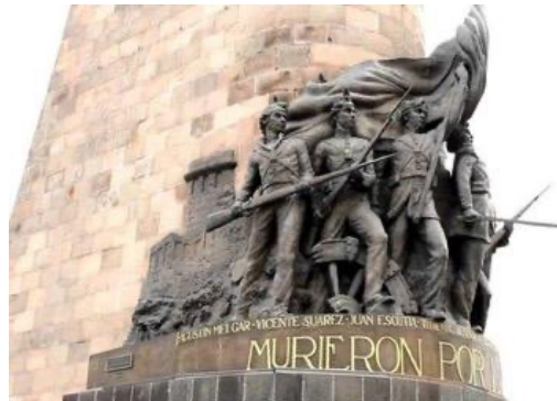
Figura 8. Grupo escultórico de los Niños Héroes

critos debajo, incluyendo a Juan Escutia portando la Bandera Mexicana y el lema «Murieron por la Patria» (Figura 8).