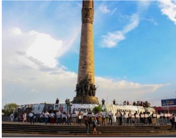
Figura 14. Manifestación del Día Internacional de las Víctimas de Desapariciones Forzadas Nota. Manifestación del 30 de agosto de 2019, Día Internacional de las Víctimas de Desapariciones Forzadas, en el Monumento a los Niños Héroes en Guadalajara, Jalisco, México, donde se observa la pancarta colocada con su nuevo nombre: «Glorieta de Las y Los Desaparecidos».

En mayo de 2021, una manifestación convocada por varios colectivos, entre ellos la Universidad de Guadalajara, llamada Marcha por la Paz y la Justicia, reunió cerca de 10 000 personas para exigir la localización de las 12 680 personas desaparecidas en Jalisco (Ríos, 2021).