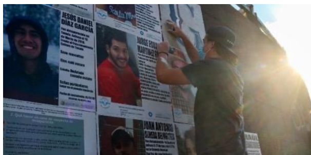
Figura 16. Colocación de losetas

Nota. Losetas adheridas a la base del monumento y lonas atadas a los barandales de La Glorieta de Las y Los Desaparecidos o Monumento a los Niños Héroes en Guadalajara, Jalisco, México. Fotografía tomada por Marco Antonio Chávez Aguayo, el 2 de diciembre de 2021.