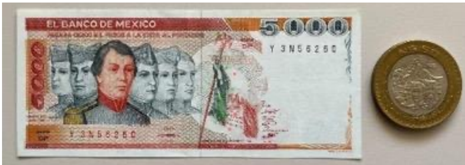
Figura 7. Los Niños Héroes en billetes y monedas

De este modo, los Niños Héroes son conmemorados en distintos monumentos a lo largo del país, nombran a múltiples vías en varias ciudades e, incluso, han sido efigie de diversas ediciones de billetes y monedas de pesos mexicanos que han estado en circulación (Figura 7).