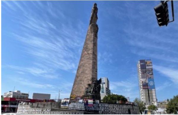
Figura 2. Vista Poniente del Monumento a los Niños Héroes

Nota. Vista Poniente del Monumento a los Niños Héroes antes de su intervención durante las protestas de 2018 en adelante en Guadalajara, Jalisco, México.