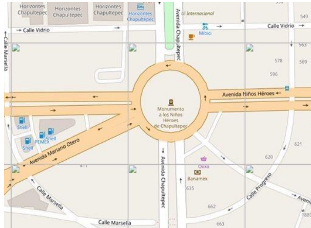
aFigura 1. Ubicación del Monumento a los Niños Héroes

Monumento a los Niños Héroes, ubicado sobre la rotonda o glorieta 38 que se encuentra en la intersección de las Avenidas Chapultepec, Niños Héroes, Francia y Mariano Otero (ver Figura 1).